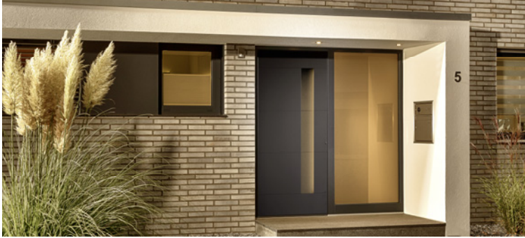
RGBW-Stripe der Haustür